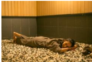
カラダの芯から温める 仙人蒸し風呂