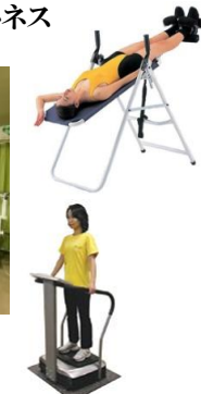
脊椎矯正・筋力アップ 若返りフィットネス