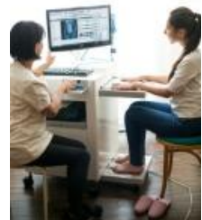
自分の体の健康チェック EISコンピューター診断