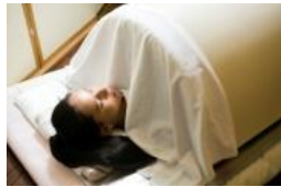
カラダの老廃物を汗で出す 遠赤外線温熱ドーム